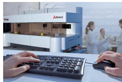
Gute Arbeit. Biotest veröffentlicht vorläufige Ergebnisse, die über den Erwartungen lagen.

Fazit: Es bedarf schon eines gewissen Optimismus für die Aktie, um in das Discount-Zertifikat zu investieren, schließlich ist der Cap (35 Euro) nicht weit. Ein Rückgang der Aktie um rund 13 Prozent indes, führt noch nicht zu Verlusten beim Investment. Maximal ist eine Rendite von knapp zehn Prozent pro Jahr möglich.