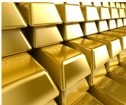
Faszination Gold: Zertifikate können eine Alternative zu einem Direktinvestment darstellen.

Fazit: Wer nicht mit vollem Risiko in Gold investieren will, findet in einem Bonus-Cap-Zertifikat von Goldman Sachs eine reizvolle Alternative. Das währungsge-sicherte Produkt wird am Laufzeitende im Dezember 2010 mit einer Bonusrendite von 9,2 Prozent pro Jahr zurückgezahlt, sofern der Preis je Unze bis dahin niemals auf oder unter die Barriere bei 900 Dollar gefallen ist. Das entspricht einem Sicherheitspuffer von aktuell 19,8 Prozent. Dafür sind die Gewinnchancen durch den Cap auf die Bonusrendite begrenzt.