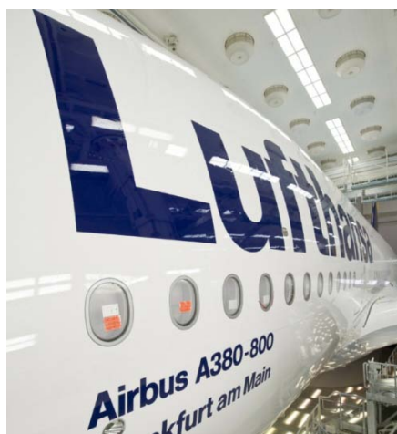
Am Boden geblieben: Die Lufthansa schrieb im vergangenen Geschäftsjahr rote Zahlen.

Die Ergebnisse des Lufthansa-Konzerns im Jahr 2009 sind eher mau. Dennoch bekommt die Aktie Aufwind. Wer dem nicht traut, investiert mit Safety Belt.