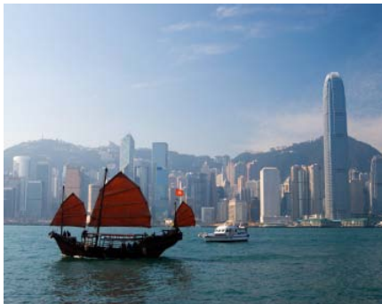
Börsenplatz Hongkong: Der HSCEI Index bildet die Wertentwicklung der wichtigsten H-Shares ab.

Fazit: Ein interessantes, aber auch komplexes Produkt. Detaillierte Information ist vor einem Kauf daher Pflicht.