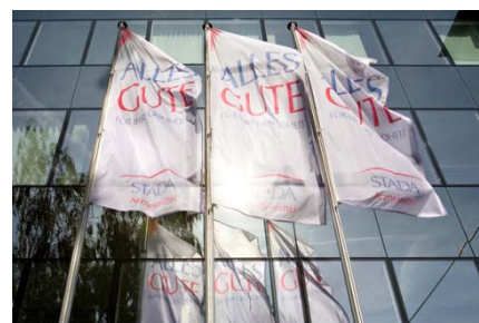
Das Arzneimittel-Unternehmen Stada steigerte 2009 den Konzerngewinn um stolze 32 Prozent.

Fazit: Das Discount-Zertifikat von BNP Paribas auf Stada ist etwas für konservativere Naturen. Der Rabatt gegenüber dem Direktinvestment fällt mit gut 20 Prozent ordentlich aus. Bis zum Cap bei 24 Euro ist auf das Jahr gerechnet eine zwar nicht spektakuläre, aber akzeptable Seitwärtsrendite von 8,5 Prozent drin.