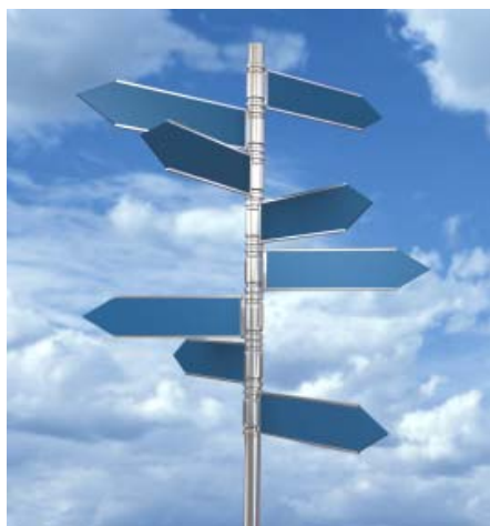
In der Theorie sollen Anleger mit Hedgefonds von steigenden und fallenden Kursen profitieren können.

JP Morgan lanciert ein Hedgefonds-Zertifikat auf einen Index, der sich aus nicht weniger als 26 Strategien zusammensetzt und monatlich neu gewichtet wird.