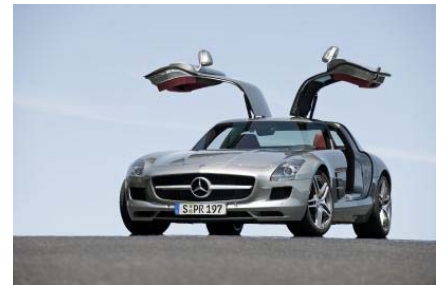
SLS AMG: Nicht nur die Aktionäre von Daimler dürfen ihren Träumen wieder Flügel verleihen.

Fazit: Für konservativere Naturen, die zwar grundsätzlich optimistisch, aber doch mit einer gewissen Skepsis in die Daimler-Zukunft blicken, könnte das Citi-Discount-Zertifikat interessant sein. Es bietet einen Discount von gut 21 Prozent und bis zum Cap (32 Euro) eine Seitwärtsrendite von 6,4 Prozent (auf das Jahr gerechnet).