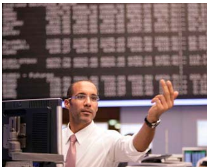
Mit dem Europa Performance Plus-Zertifikat hat man die Chance auf 19,5 Prozent Seitwärtsrendite.

Fazit: Ein Seitwärtsprodukt, mit attraktivem Chance-Risiko-Profil. Vor einem Kauf sollte man sich aber noch detailliert über das Auszahlungsprofil informieren.