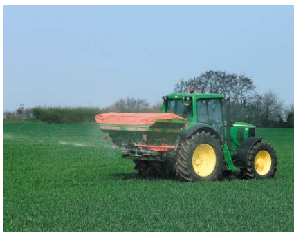
K+S profitierte im ersten Quartal 2010 von einer anziehenden Nachfrage nach Düngemitteln.

Fazit: Trotz des guten Jahresauftakts musste auch die Aktie von K+S infolge der eingetrübten Börsenstimmung zuletzt deutliche Verluste hinnehmen. Immerhin: Die Unterstützung an der 40 Euro-Marke scheint sehr robust zu sein. Genau dort liegt auch der Cap eines Discount-Zertifikats der Deutschen Bank. Notiert K+S am Laufzeitende im Juni 2011 auf oder über dieser Marke, wird das Zertifikat mit einer (maximalen) Rendite von 12,9 Prozent zurückgezahlt. So lässt sich auch von einer Seitwärtsbewegung profitieren.