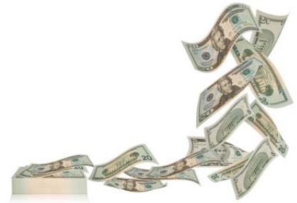
Steigt der Dollar gegenüber dem Euro weiter an oder schafft der Euro – zumindest kurzfristig – die Wende?

Fazit: Auf Jahr umgerechnet kommt mit dem Capped-Bonus-Zertifikat immerhin eine maximale (Seitwärts-)Rendite von gut 14 Prozent zusammen. Maximal deshalb, weil das Produkt bei 124,71 Euro gekappt ist. Das Risiko: Ein Euro-Absturz bis Mitte Dezember auf oder unter die Barriere von 1,15 Dollar.