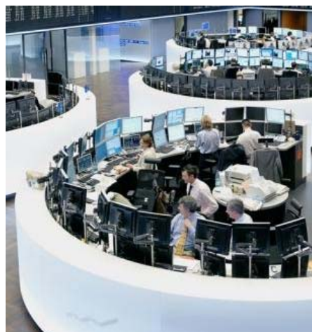
An den europäischen Börsen wird derzeit heftig über mögliche Inflationsgefahren diskutiert.

Die Eurokrise schürt Inflationsängste. Die Morgan Stanley Inflationsanleihe bietet einen Mechanismus, um Preissteigerungen nominal auszugleichen.