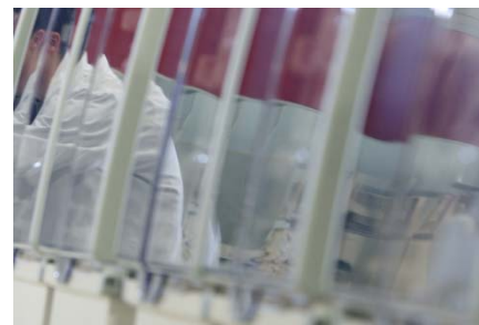
Produktion der Dialysemaschine 5008 bei Fresenius Medical Care in Schweinfurt.

Fazit: Bei einer übersichtlichen Laufzeit von knapp sieben Monaten bietet das Bonus-Zertifikat von BNP Paribas einen recht großzügigen Sicherheitspuffer von rund 28 Prozent. Es ist fast schon klar, dass bei diesen Konditionen die Rendite mit 3,3 Prozent beziehungsweise 5,8 Prozent pro Jahr etwas schmaler ausfällt.