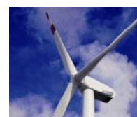
Windkraftanlage von Nordex: Das Unternehmen litt im ersten Quartal unter der Flaute bei den Auftragseingängen.

Fazit: Mit einem Discount-Zertifikat der Deutschen Bank können Anleger auch von einer Seitwärtsbewegung der Aktie profitieren. Sollte Nordex [aktueller Kurs: 6,99 Euro] am Laufzeitende im Dezember 2010 auf oder über dem Cap bei 6,00 Euro notieren, würde das Zertifikat mit einer annualisierten Rendite von derzeit 17,2 Prozent zurückgezahlt.