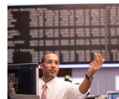
An den Aktienmärkten ist die Volatilität zuletzt gestiegen.

Fazit: Der vergünstigte Einstieg reduziert das Risiko. Dafür sind die Gewinnchancen auf den Cap begrenzt.