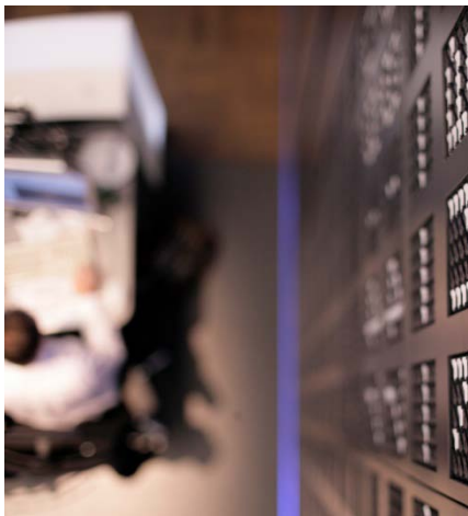
Das Börse-Online-Anlegerforum findet am 12. Juni in München statt. Jetzt Freikarten sichern.

Sie wollen sich über die neuesten Investmenttrends und Anlageproduktinnovationen informieren? Dann auf nach München zum Börse-Online-Anlegerforum. fastscoach-Leser haben die Chance, 10x2 Scoach-Freikarten zu gewinnen.