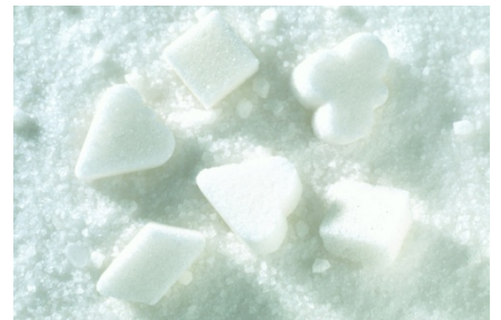
Glückszucker von Südzucker: Steigen die Preise des süßen Rohstoffs nach dem Einbruch wieder an?

Fazit: Stiege der Zuckerpreis (Basiswert) zum Beispiel in den kommenden 30 Tagen auf 17 US-Cent (+6,9 Prozent), dann stünde der Mini-Future voraussichtlich bei 5,72 (+ 18 Prozent) Euro, bei unverändertem Euro-Dollar-Kurs. Vorsicht: Der Hebel wirkt auch nach unten. Beim Berühren des Stopp-loss wird die Position glattgestellt.