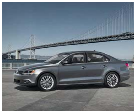
Mit dem neuen Jetta will Volkswagen in den USA verlorene Marktanteile zurückgewinnen.

Beschreibung: Volkswagen schaltet einen Gang höher. Nach einem unerwartet starken Geschäft in den ersten fünf Monaten hat der Wolfsburger Autokonzern die Gewinnprognose für das Gesamtjahr erhöht. Absatz und operatives Ergebnis hätten sich deutlich besser entwickelt als er-