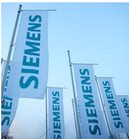
8 %-Chance: Die Siemens-Aktie muss in der Beobachtungsperiode nur einmal über der Barriere notieren.

Morgan Stanley koppelt die Chance auf eine Kuponzahlung in Höhe von acht Prozent auf Basis der Siemens-Aktie mit einer Memory- und Express-Funktion.