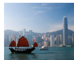
Wohin steuert Chinas Währung Yuan? Westliche Volkswirte fordern eine Aufwertung

Fazit: Interessante Anlagemöglichkeit, die auch bei einer Kursflaute chinesischer Aktien Profit verspricht.