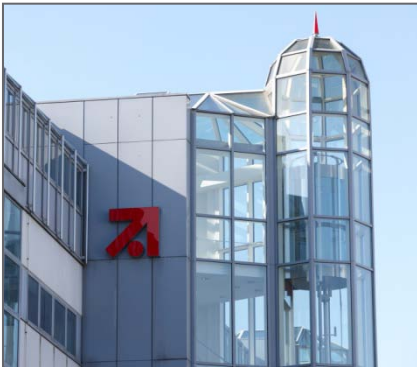
Zentrale von ProSiebenSat. 1 in Unterföhring bei München: ansteigende Werbeeinnahmen.

Beschreibung: Beim Münchner Fernsehkonzern ProSiebenSat.1 blickt man wieder optimistisch in die Zukunft: „Der Werbemarkt entwickelt sich recht positiv und diese Entwicklung spüren wir auch im Geschäft“, sagte vor kurzem Vorstandschef Thomas Ebeling. Zuversichtlich zeigen sich auch die Analysten von Barclays Capital. Sie erhöhten die Gewinnprognose für 2011 um acht Prozent. Die