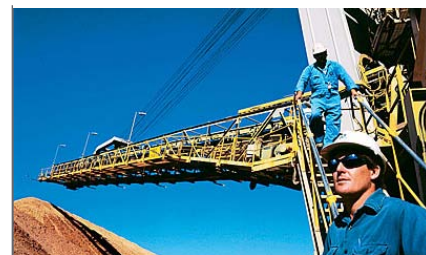
Nachfragebelegung erwartet: Alcoa-Mitarbeiter im australischen Aluminiumwerk Pinjarra.

Aktie ausgestattet: Sollte der US-Titel bis zum Laufzeitende im Dezember 2010 niemals die Barriere bei 8 Dollar verletzen (Puffer: 28 Prozent), winkt dem Inhaber eine Bonusrendite von 14,4 Prozent (35,6 Prozent pro Jahr). Das Risiko: Bei einem Schwellenbruch wären überproportionale Verluste die Folge, da das Zertifikat mit Aufgeld notiert.