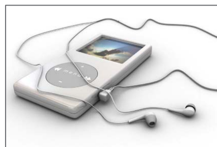
Die Chips von Dialog Semiconductor maximieren die Batterielaufzeit von mobilen Audiogeräten.

Fazit: Mit einem Discount-Zertifikat der Commerzbank lässt sich bis zu einem gewissen Grad auch bei nachgebenden Kursen noch eine ansehnliche Rendite erzielen. Notiert die Aktie am Laufzeitende im Juni 2011 auf oder über dem Cap bei neun Euro, winkt dem Inhaber eine maximale Rendite von 20,2 Prozent.