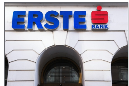
Der geographische Geschäfts-Schwerpunkt der Erste Group Bank liegt in Zentral- und Osteuropa.

Fazit: Die HSBC-Aktienanleihe auf die Erste Group zahlt einen Kupon von 13,2 Prozent pro Jahr. Außerdem erfolgt die Rückzahlung zu 100 Prozent des Nennwerts, sofern die Aktie am Laufzeitende in einem Jahr mindestens auf ihrem Startniveau notiert. Falls nicht, erfolgt die Tilgung dem Bezugsverhältnis entsprechend in Aktien.