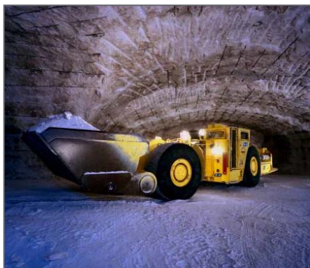
Im zweiten Quartal 2010 konnte der Düngemittelproduzent K+S Umsatz und Gewinn steigern.