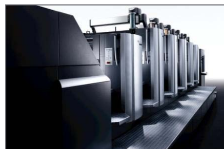
Die neue Bogenoffsetmaschine Speedmaster CX 102 Success zählt zu den leistungsfähigsten ihrer Sparte.

Fazit: Mit dem Discount-Zertifikat von BNP Paribas haben Anleger einen Schutz vor Verluste der Heidelberger-Druck-Aktie in Höhe von 20 Prozent. Auf das Jahr umgerechnet beträgt die Seitwärtsrendite knapp 17 Prozent. Dazu darf der Kurs allerdings nicht unter den Cap von 5 Euro fallen. Charme hat die kurze Restlaufzeit.