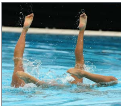
Beim neuen Duo-Memory-Express-Zertifikat darf keiner der beiden Basiswerte aus der Rolle fallen.

Beschreibung: Eine interessante Produktneuheit hat Société Générale mit ihren Duo-Memory-Express-Zertifikaten ins Sortiment genommen. Die Papiere basieren auf einer klassischen Express-Struktur. Aber wie der Name schon sagt, beziehen sich die Zertifikate auf zwei Basiswerte. Das hier vorgestellte Produkt auf die beiden Industriekonzerne MAN und ThyssenKrupp zahlt einen Kupon von elf Prozent